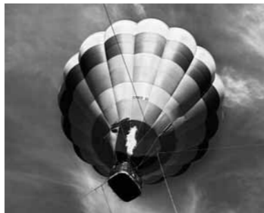
燃え上がるバーナーの炎

イベントには、2日間で400人の参加があり、笑顔あふれる、楽しいイベントになりました。