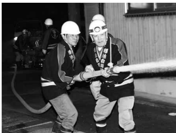
消火活動を行なう、畑池自衛消防団

火災現場に到着した消防団員は、機敏で正確な消火活動を行いました。これから暖房を使うことが多くなります。火の元には十分に注意しましょう。