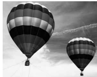
上空に舞い上がる気球