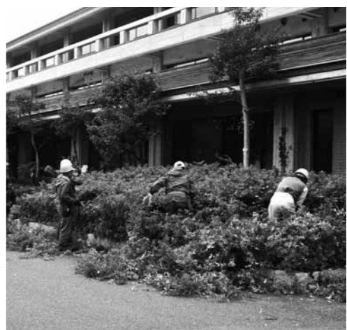
役場本庁舎の庭木剪定をする会員

シルバー人材センターでは、毎年公共施設を対象に奉仕作業を実施しており、来年以降も続けるそうです。