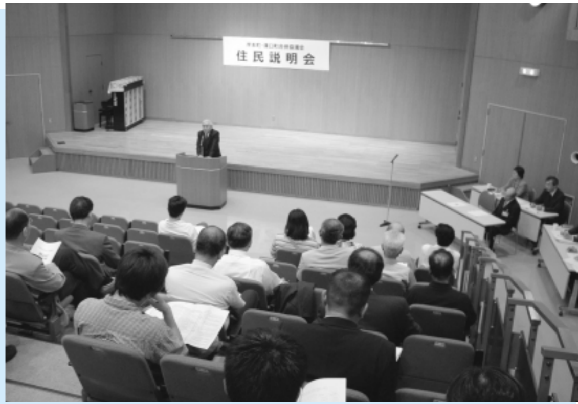
合併住民説明会(改善センター)

岸本町・溝口町合併協議会では、合併住民説明会を六月一日から両町あわせて五箇所の会場で開催し、全会場で三七〇人の町民の方がこの合併住民説明会に参加されました。