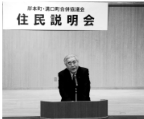
合併住民説明会にて