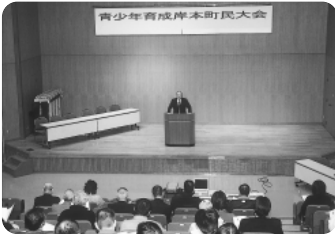
次代を担う青少年の健全な育成を目指して