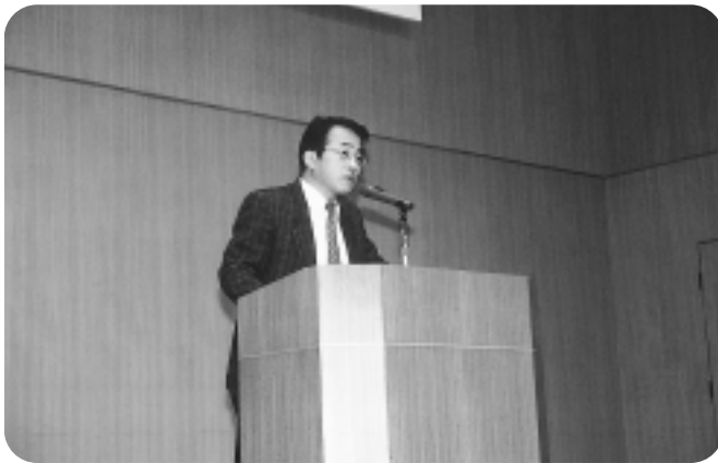
最近の小中高生の実態について報告

青少年育成岸本町民大会が、子どもたちの食事と生活をメインテーマに2月21日（土）、岸本町農村環境改善センターで開催され、約60人の方が参加しました。