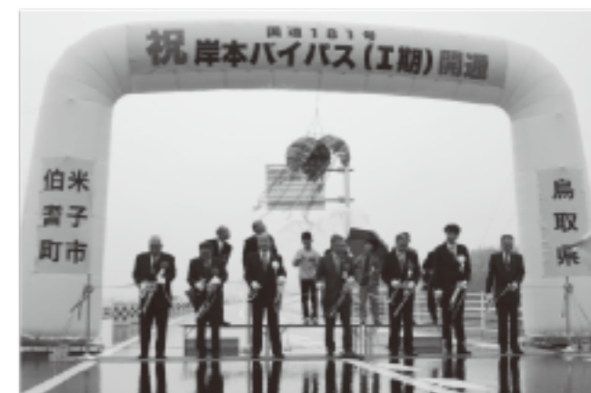
国道181号岸本バイパスの一部開通を祝して、テープカット・くす玉開披をする関係者

今回は、全長5.7kmの内、諏訪から坂長までの2.2kmが完成し、利用できるようになりました。これにより、地域の方々の安心・安全な生活や利便性の向上、地域の連携による活性化に、大きな役割を果たすものと期待されます。