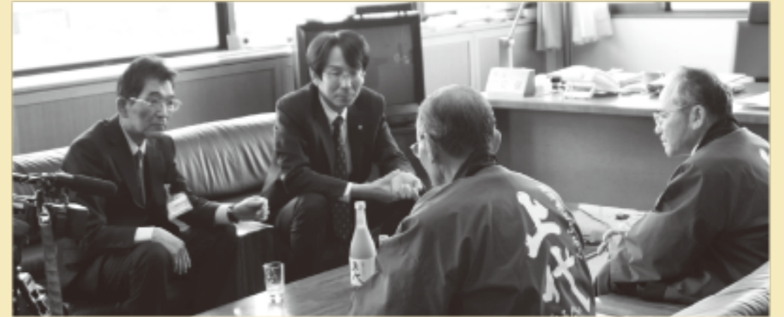
どぶろくの完成を記念して、株式会社 上代から表敬訪問を受ける町長

さて、3月18日には本町の新年度予算も成立いただき、いろいろな新しい取り組みが始まります。予算の概要は町報やケーブルテレビで紹介する機会がありますので詳しくは説明しませんが、大きな傾向として、「財政に若干ではあるが好転の兆しが出てきたこと」、このため、「ワクチン接種などの予防医療や中学生までの医療費助成の拡大など、独自の事業を手掛