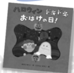
『ハロウィンドキドキおぼけの日!』 ますだゆうこ/作 たちもとみちこ/絵 文溪堂