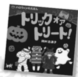
『トリックオアトリート!』 岡村志満子/作 くもん出版