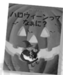
『ハロウィーンってなあに?』 クリステル・デモノー/作 中島さおり/訳 主婦の友社