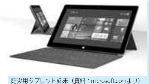
防災用タブレット端末 (資料：microsoft.comより)