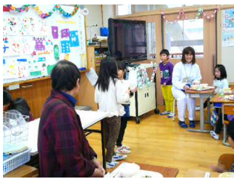
生産者さん、調理員さんに感謝の手紙 (岸本小学校)