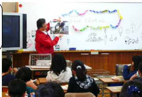
八郷小学校 岸本小学校

他にも、岸本中学校で大山乳業さんの出前講座が行われたり、八郷小学校で調理員さんとの交流給食が行われたりしました。その他の学校でも、委員会活動などを通して、食べ物や生産者さんに感謝するイベントが行われました。