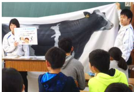
大山乳業さんに牛乳ができるまでを教わったよ。