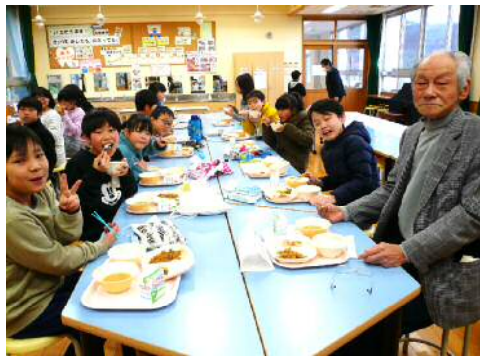
生産者さんと交流給食 (二部小学校)

1月の全国学校給食週間に合わせて、生産者さんや大山乳業さん、調理員さんとの交流給食が行われました♪