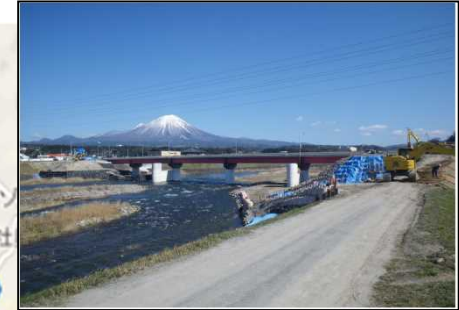
【国道181号伯耆橋歩道橋】