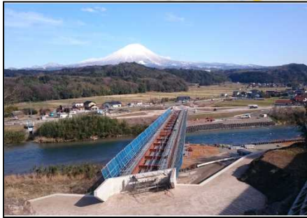
【国道181号岸本バイパス】