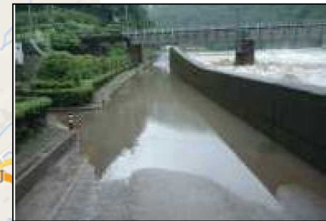
【国道181号佐川～根雨原バイパス】