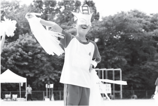
白組のアピールタイム