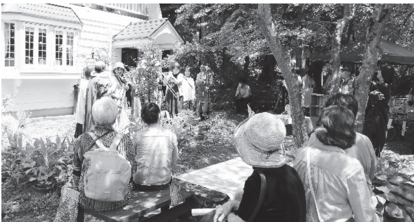
演奏に聴き入る来場者のみなさん

ペンションの前でアコーディオンやオカリナの演奏会が始まると、その美しい音色に人々はうっとり。来場者は「開催を楽しみに待っていた」「心地の良い音楽を聴きながら、素敵な庭を眺めて癒された」と話し、ゆったりと流れる時間を満喫していました。