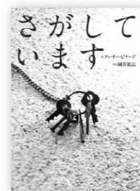
溝口・岸本図書館所蔵

広島にピカドンが落とされた時、多くの命が奪われ、同時に物たちの主人もいなくなりました。みんなの生活は、どこへいったのか。ピカドンを体験した物たちが、さがしています。人が戦争について語る本はありますが、物が語りべとなった本は、あまりないのではないのでしょうか。戦争の本は苦手だな、という方にもおすすめです。