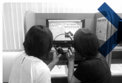
ヘッドホン を複数で使う。