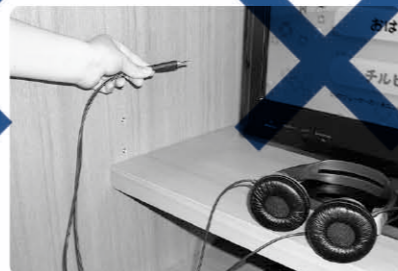
ヘッドホンの線を 外して見る。