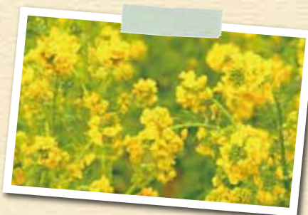
伯耆町の花「菜の花」