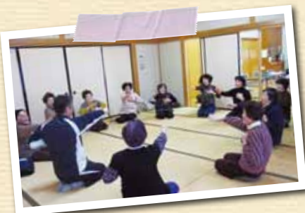
まめまめクラブ(60歳以上対象の運動教室)