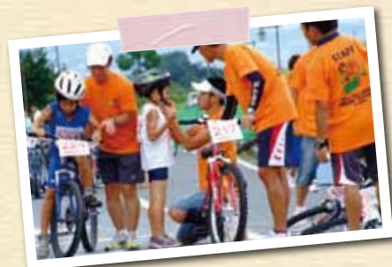
オール・ジャパン・ジュニアトライアスロンIN伯耆