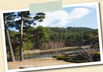
ため池100選に選定された大成池