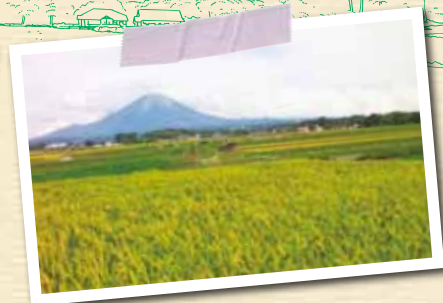
大山の裾野に広がる大原千町