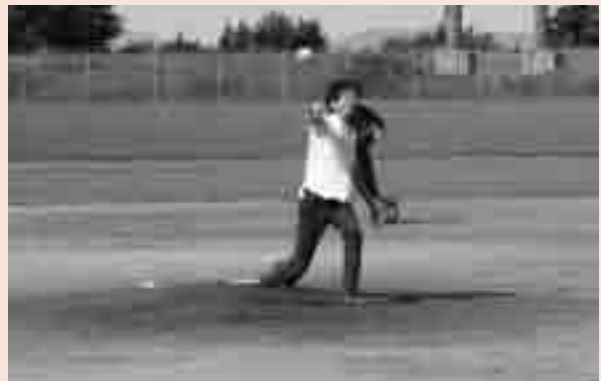
伯耆町野球大会で始球式を行う町長

さて、今回は少し難しいですが、町財政を取り上げます。本町の財政規模は一般会計(家計みたいなもの)が年間70億円程度、特別会計など(同居人の家計みたいなもの)が年間30億円程度あります。4月に始まり翌年の3月までの1年間を単位として運営し、予算は3月、決算は9月に公表となります。当然のことながら自治体会計に赤字はありません。収入が不足すれば基金(貯金)を取り崩すなどして均衡を保ちます。近年、本町では行財政改革の効果で年間2〜3億円程度の単年度黒字を保っています。この黒字は一