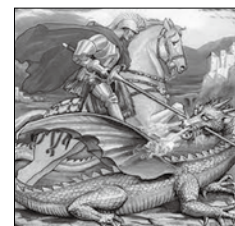
竜と戦う聖ジョージ