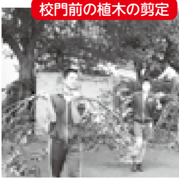
校門前の植木の剪定

文化祭前には、1年生が劇の中で手話をしながら歌を披露するため、ボランティアの方に手話指導をしていただきました。