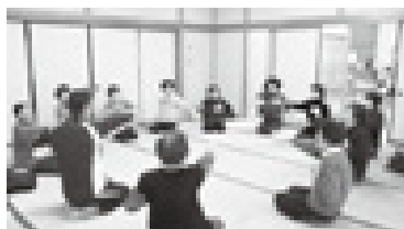
健康ポイント制度