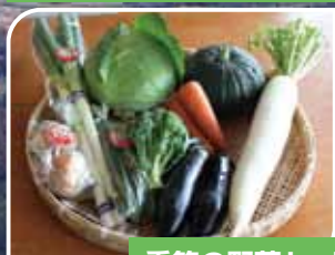
季節の野菜セット