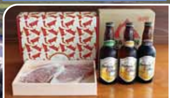
鳥取和牛サーロインステーキ200g×2枚と 大山Gビール330ml×3種類