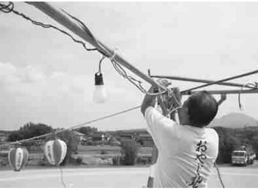
ボランティアによるやぐらの設営