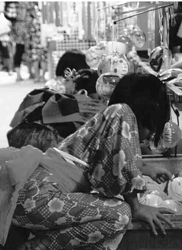
風船すくいを楽しむ子供たち

【問い合わせ先】 実行委員会事務局(伯耆町商工会) ☎68-2174 商工観光課 ☎68-4211