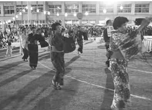
きしもと音頭に合わせて踊ります