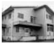
岸本学校給食センター

町内には「岸本学校給食センター」と「溝口学校給食センター」の二つがあります。それぞれ岸本地区、溝口地区の小中学校へ、給食をつくり、届けています。また、栄養管理、食習慣、楽しい食事のマナーなど、食に関する指導も行っています。