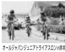
オールジャパンジュニアアスロンin岸本

今年度のおもな事業は、 ・ 各種体育関係補助金助成ス ・ ポーツ振興事業団、体育協会、団体体育協会、ゲートボール協会、グラウンドゴルフ協会、剣道大会等） ・ オールジャパンジュニアア ライアスロンin岸本大会 開催（全国各地から小学生を中心に選手募集、今年十 一回目を迎える） ・ 岸本や溝口の体育館などの スポーツ施設の管理運営、 スポーツ活動の場所提供等 ・ 町民運動会補助金 （溝口地区） などです。