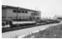
総合スポーツ公園