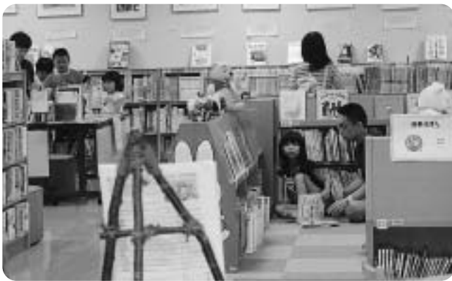
自由研究や絵本のコーナーは家族連れで大にぎわい！