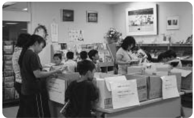
大盛況！！「廃棄本のリサイクル市」