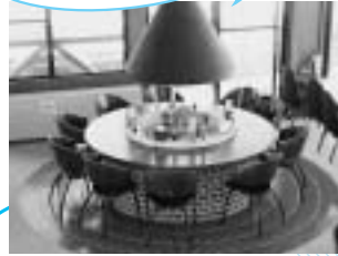
暖炉を囲んだ雰囲気丸テーブル