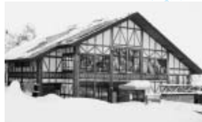
フィールドステーション外観