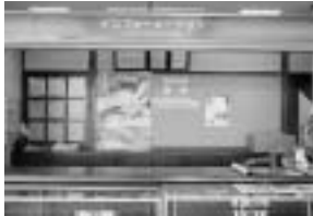
榎水高原の案内ならおまかせ!