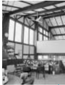
天井が高く、開放感あふれる店内