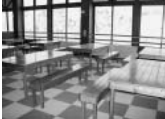
集まってワイワイ話せる“レクチャールーム”