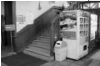
階段入口付近には自動販売機があります