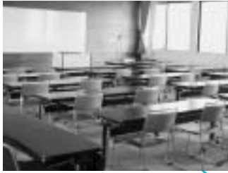
皆で学習会などもできる“会議室”

榎水高原内に整備された口グハウス風のおしゃれな外観の建物です。ここは、レストランとして、便利な無料休憩所として幅広く利用することができます。夏は榎水高原散策の喫茶としてご利用いただけますし、この冬の雪の降るスキーシーズンには、ランチやちょっとしたティータイムに、気軽にご利用いただけます。