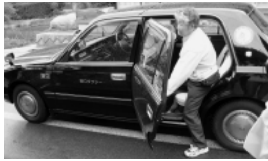
初めてのお客さんです

5月10日(水)、大倉集落で、伯耆町デマンドタクシーの試行が始まりました。この事業は、大倉集落の高齢者や免許を持たない方などを対象に、町が有料(200円)でタクシーを配車する事業です。大倉集落のみならずぜひご利用ください。