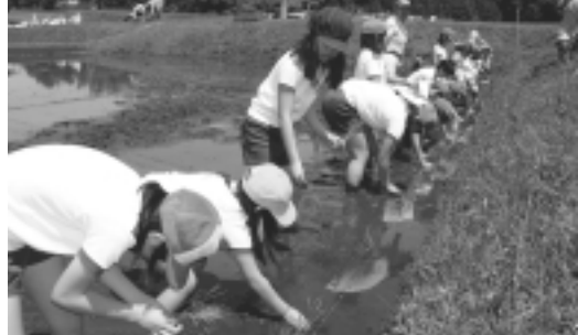
地域の方々に教わりながら田植えをしました

5月12日(金)、八郷小学校と清山集落の田植え。清山集落で、八郷小学校の4、5年生の児童27名が、地域の方々の指導により田植えを体験しました。田植え終了後は、清山女性会の方々がつくられた昼食をいただき会話を弾ませながら楽しい交流をされました。