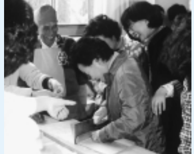
徐々に打ち解けてきたそば打ち交流

4月21日(金)、日光公民館で、鬼つこそばの会、このそばの会と韓国からの旅行者のそば打ち交流が行なわれました。身振り手振りの交流で、笑顔あふれる楽しい交流でした。「韓国のおそばは味が全く違うけれどおいしい」という感想が聞かれました。