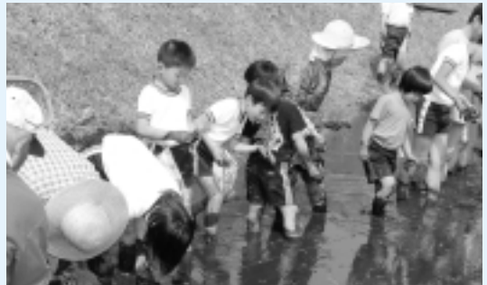
だんだん上手に植えられるようになりました

5月22日(月)、添谷集落で、日光小学校の全校児童が、初めて入る水田の感触を裸足で感じながら、地域の方々の指導により、田植えを体験しました。田植え終了後は、添谷集落の方々がつくられたはしまを食べながら楽しい交流ができました。