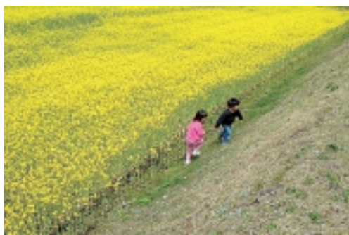
なすかさん(鳥取県)タイトル 菜の花畑でダッシュ!

側から丸山集落に広がる菜の花を対象にデジタルカメラで撮影された作品が多数寄せられました。ご応募ありがとうございました。