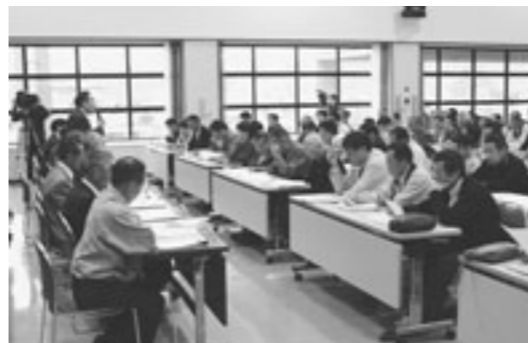
4月23日、区長協議会設立総会を開催