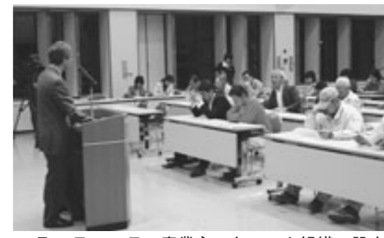
5月12日・13日、産業ネットワーク組織の設立に向けて説明会を実施。町内の商工農業従事者や住民団体代表などが集まりました