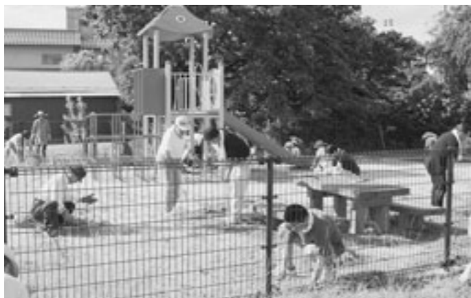
▲清掃活動の様子 (伯耆溝口駅前の公園)