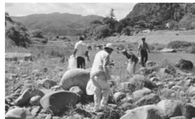
▲日野川一斉清掃の様子（鬼守橋周辺）

伯耆町では、環境に関するさまざまな活動を行うことで、すばらしい自然環境を持つ伯耆町を次世代へ伝え、残すように取り組んでいます。