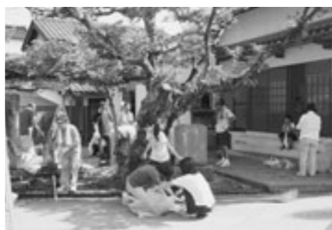
▲溝口二区ふれあい会館

初めての取り組みということもあり伯耆町環境美化の日の清掃活動が難しい集落は、活動日をずらして行われました。町民みなさんの活動により町内の道路や川辺、公園などが整えられ、町がいちだと美しくなりました。