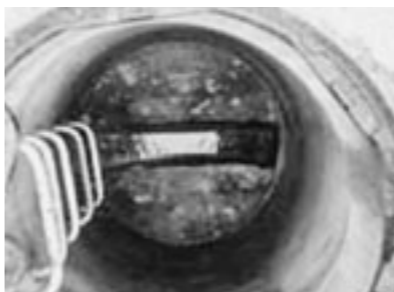
▲正常な下水道(マンホール)