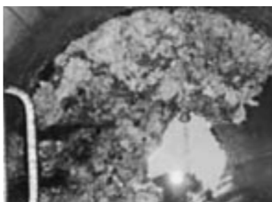
▲下水道(マンホール)の中で固まった油

保守・管理を正しく行わずに下水道本管が詰まった場合は、復旧費用を負担していただく場合があります。