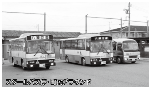
スクールバス停・町民グラウンド

友だちとおしゃべりをしながらの登下校はいつも楽しく、趣味や宿題などの話をして静かに盛り上がります。友だちとクラスや部活が違って、バスの中で話せることもうれしく感じるものの一つです。