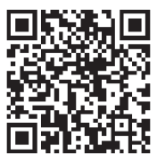
伯耆町ホームページ

工事着手前に申請が必要です。申請は随時受け付けています(予算が無くなり次第、終了)。