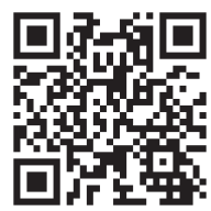
伯耆町ホームページ