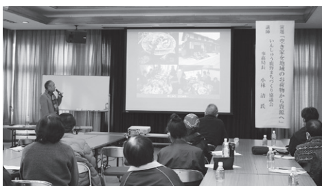
様々な空き家活用の取組事例を紹介

二部活会長は「『空き家をお持ちの方』と『空き家を探しの方』双方の意見をよく聞き、行政や関係機関、自治会や関係者等と連携しながら活用方法を見出しにくいことの難さを学んだ」と話しました。