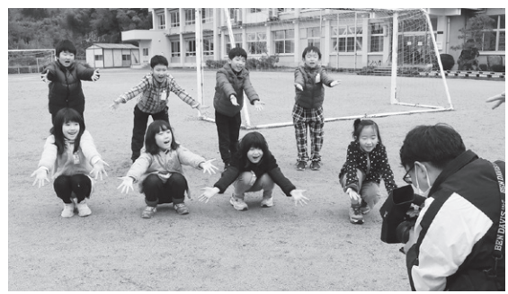
二部しいたけを全町にアピール

このしいたけ体操は、伯耆町有線テレビジョン放送のチャンネルで2月1日から1か月程度、CM放送を行います。