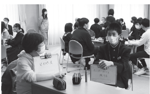
「自分のいいところ」って何だろう

当日は溝口中学校2年生、島根大學生、地域住民など合わせて約50名が参加し、6～8名ずつのグループに分かれて「人から言われた、自分のいいところは？」「どんな大人になりたい？」などのテーマで自由に話し合いました。この活動を終えた中学生は、「普段大人の方と話す機会がないのでとてもいい時間だった」「将来やりたいことが決まっておらず不安な気持ちもあったが、まずは自分の好きなことから世界を広げてみようと思った」などと振り返りました。