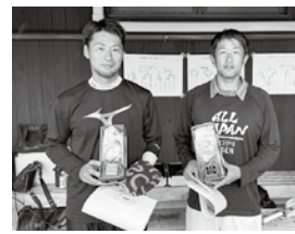
個人戦男子の部優勝