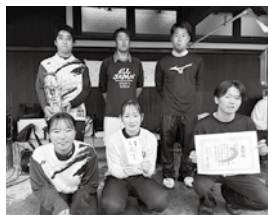
団体戦優勝 Daisen A

5月12日、大山ガーデンブレイス・テニスコートを会場に、第20回伯耆町ソフトテニス大会が開催されました。町内の集落、中学校、同好会などによる団体戦と、男女別ダブルスによる個人戦を実施しました。当日はあいにくの雨となりましたが参加選手による熱戦が展開されました。