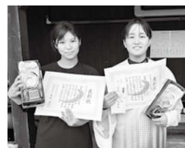
個人戦女子の部優勝