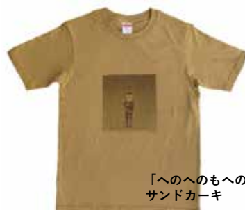
「へのへのもへの」 サンドカーキ