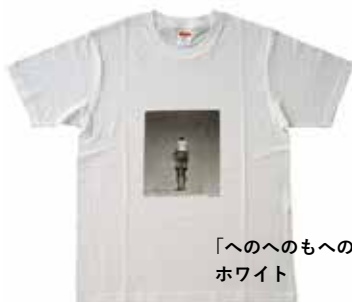
「へのへのもへの」 ホワイト