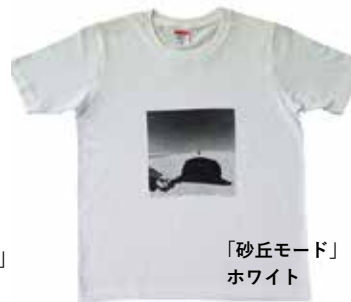
「砂丘モード」 ホワイト