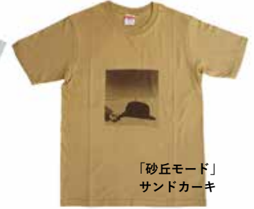
「砂丘モード」 サンドカーキ