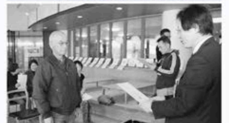
100P達成者 表彰式の様子