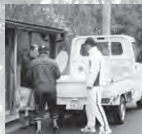
▲伯耆ニュータウンでのごみ収集の様子