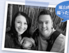
嵐山の竹林で撮った家族写真