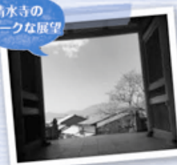
清水寺のユニークな展望