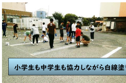
小学生も中学生も協力しながら白線塗り

▼6月11日(日)、伯耆町商工会青年部の皆さんが、鳥取県商工会青年部全国統一事業「絆感謝運動」の一環として岸本公民館駐車場(保育所側)の薄くなった白線を岸本中学校中学生ボランティアの皆さんと一緒にきれいに塗っていただきました。暑い最中でしたが、中学生ボランティアの皆さんも養生テープ張やペンキ塗りを協力しあいながら作業し、午後1時から始まった作業も午後2時30分頃には白線をきれいに塗り終わりました。駐車場の利用者の皆さんも気持ちよく利用していただけたと思います。商工会青年部の皆さんや中学生ボランティアの皆さん、その他ご協力いただいた皆さんありがとうございました。