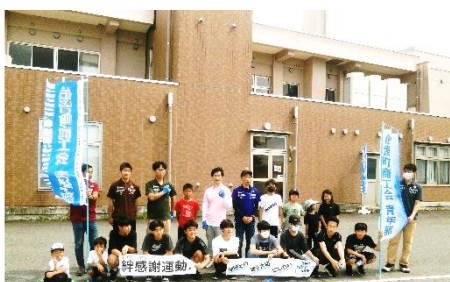
白線塗りを終え全員そろって記念写真

▼6月11日(日)、伯耆町商工会青年部の皆さんが、鳥取県商工会青年部全国統一事業「絆感謝運動」の一環として岸本公民館駐車場(保育所側)の薄くなった白線を岸本中学校中学生ボランティアの皆さんと一緒にきれいに塗っていただきました。暑い最中でしたが、中学生ボランティアの皆さんも養生テープ張やペンキ塗りを協力しあいながら作業し、午後1時から始まった作業も午後2時30分頃には白線をきれいに塗り終わりました。駐車場の利用者の皆さんも気持ちよく利用していただけたと思います。商工会青年部の皆さんや中学生ボランティアの皆さん、その他ご協力いただいた皆さんありがとうございました。