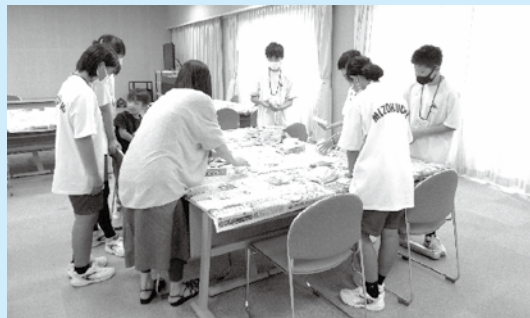
溝口公民館「クリニカルアート教室」での中学生ボランティア

地域学校協働活動を通して、みんなが元気になる、地域が元気になるよう、これからもご協力お願いします。