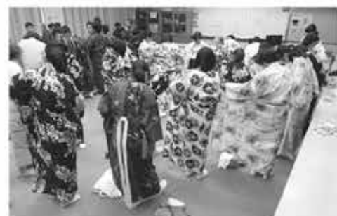
▲着付け教室の様子

これからも、地域の皆さんと連携・協働して子どもたちの成長を支えていきたいと思っています。どうぞよろしくお願ひします。