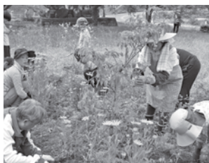
朝の環境整備作業

日光小では、環境整備や安全見守り、学校行事参加支援などで多くの方々にお世話になっていきます。このような活動を通して、児童一人一人が明るく伸び伸びと育つようご協力をお願いいたします。 年度の終わりには、子どもたちと支援いただいた方々との交流会を行います。支援活動を通して、児童一人一人の成長と共に、関わった支援者が喜びと感動を共有できるような一年にしていきたいと思えます。