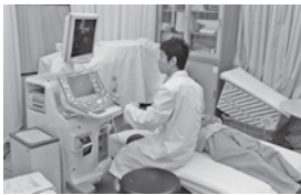
頸動脈エコー検査