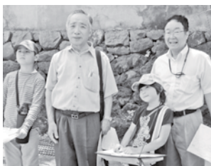
栃原のまちたんけん

また、多くの方々に学校に来ていただくために、月ごとの学校支援活動の案内を支援者の方へ送付しました。活動の様子については、学校便り(全戸配布)や有線テレビなどにより、詳しくお知らせしています。