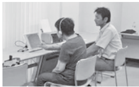
コンピューターによる頭の健康チェック

【問い合わせ先・申込み先】 伯耆地域包括支援センター (健康対策課生活相談室内) ☎68-4632