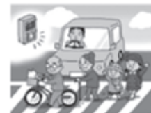
町民みんなで交通安全を 心がけましょう