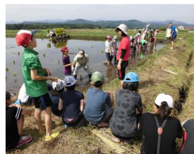
(今年も八郷小学校の児童たちが東北支援米を植えました 久古地内にて)