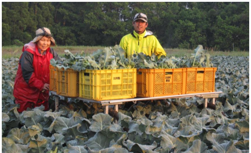
(ブロッコリーの収穫作業中)