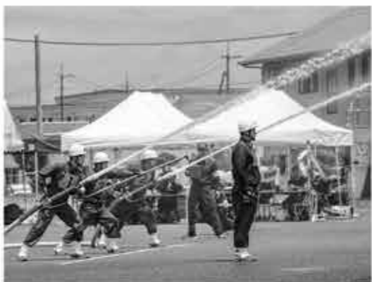
▲的に向かって放水