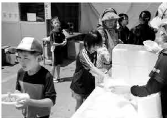
▲作業の後はおいしいカレーで腹ごしらえ