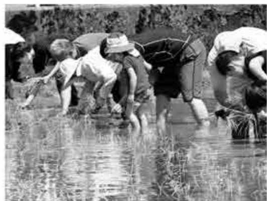
▲みんなでそろって苗を植えています