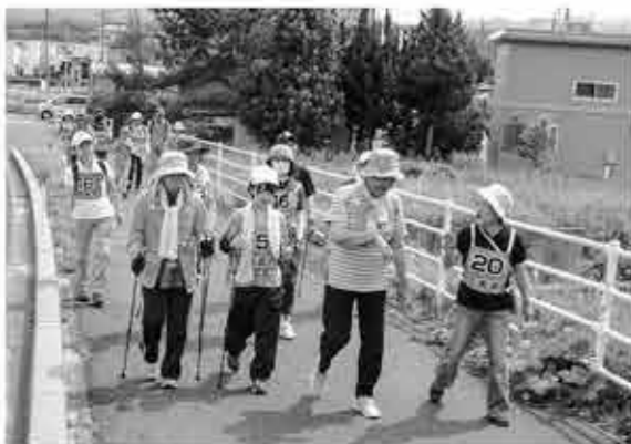
▲自分のペースで歩きます