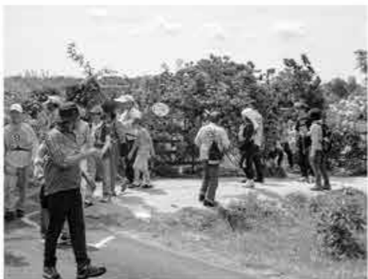
▲バラを鑑賞しながら疲れを癒します