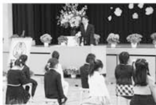
▲溝口小学校入学式で祝辞を贈る町長(溝口小体育館、4月8日)

本町でも全てが順調なわけではありませんが、熱利用という出口まで辿り着いていることに意義があると、改めて感じました。同様の処理システムを志向するところも増えてきており、事例が拡大することで、一層の技術革新につなげていきたいと思った次第です。