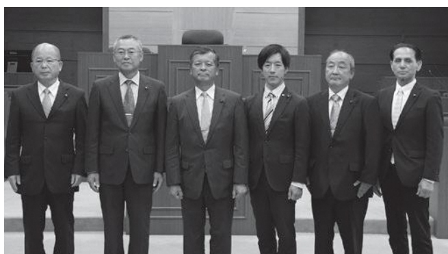
文教民生常任委員会