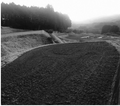
手入れされた山間農地

答 町長 個々に集約を進めても限界があり、集落営農のような経営体制づくりが必要。また、担い手が不足する地域でも、生産性の高い農地については、しっかり引き継いでいけるよう支援する。