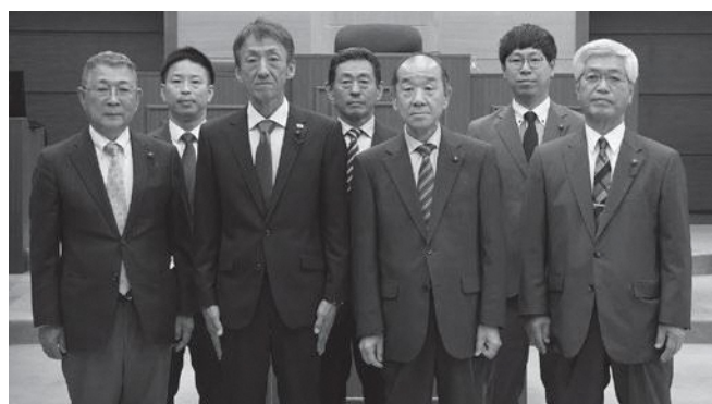
総務経済常任委員会