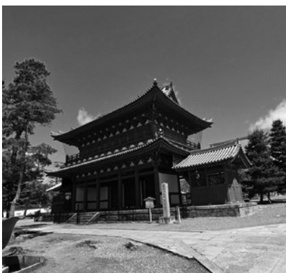
修学旅行のイメージ

答 教育長 既に補助の給食費のほか、まずは学用品費、制服購入費の補助から検討していきたい。